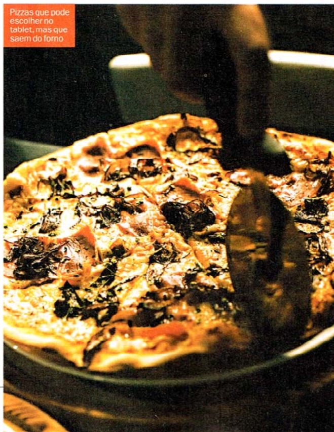
Pizzas que pode escolher no tablet , mas que saem do forno