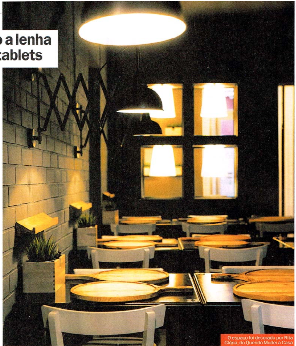
O espaço foi decorado por Rita Glória, do Querido Mudei a Casa

O menu está muito bem apresentado no tal tablet . Poucas entradas, das quais vale a pena provar as azeitonas panadas, uma imagem de marca do chef Vitali. Passando para as pizzas, a descrição dos ingredientes está lá e as imagens são ilustrativas. A Luzzo leva cogumelos Portobello, ananás caramelizado e bacon (10,75€); a Siffredi (sim, o actor porno) vem com ventricina – um chouriço picante italiano – rúcula e balsâmico (8,80€); a